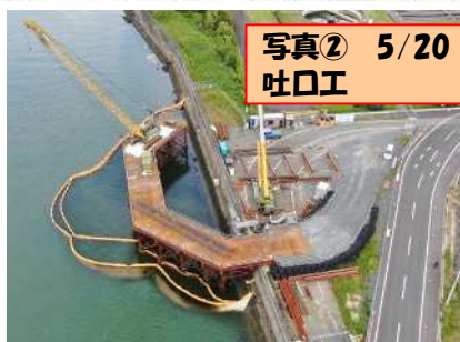
写真② 5/20 吐口工