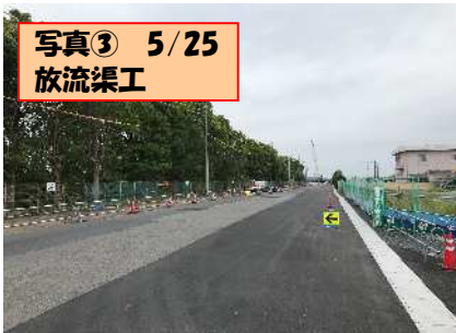
写真③ 5/25 放流渠工