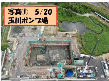
写真① 5/20 玉川ポンプ場